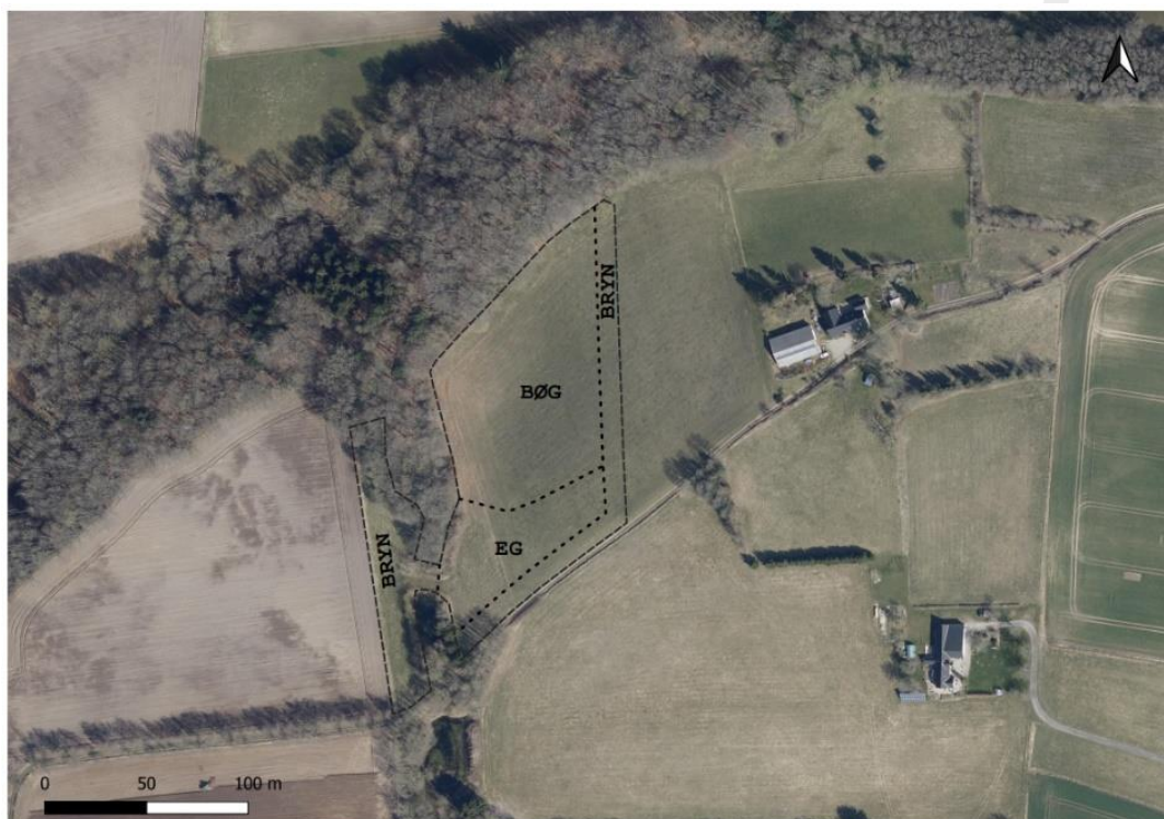
Kort modtaget af ansøger der viser skovtype på projektarealet med målestoksforhold og nordpil.

Der ønskes skovplantning på 1,5 hektar af matr.nr. 53E Tåning By, Tåning. Landbrugsejendommen har adressen Lundumvej 4, 8660 Skanderborg. Arealet etableres som skovbryn og løvskov.